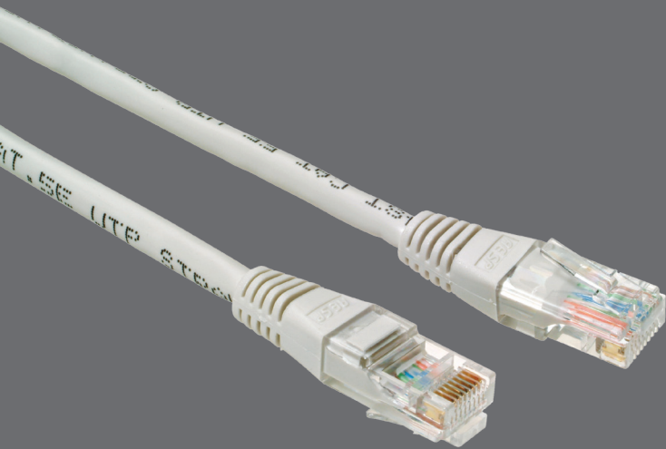
Patchcordeny z osłonką non-snag-proof